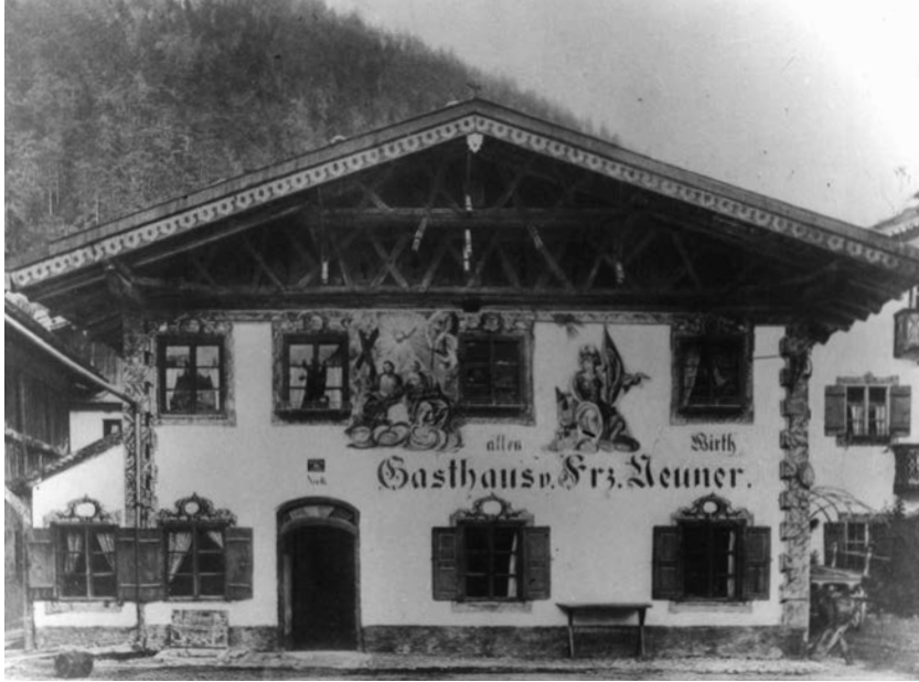
Oben: Gasthof von Franz Neuner in Wallgau 1910, heute Gasthof zur Post, mit Fresken von Franz Karner (Foto Werdenfels Museum).

Er: Schmale Lodenjoppe aus steirischem Merinoloden in zwei Farben 349 €, Stehkragenweste aus Paisley-Jacquardgewebe 159 €, Hose von Meindl.