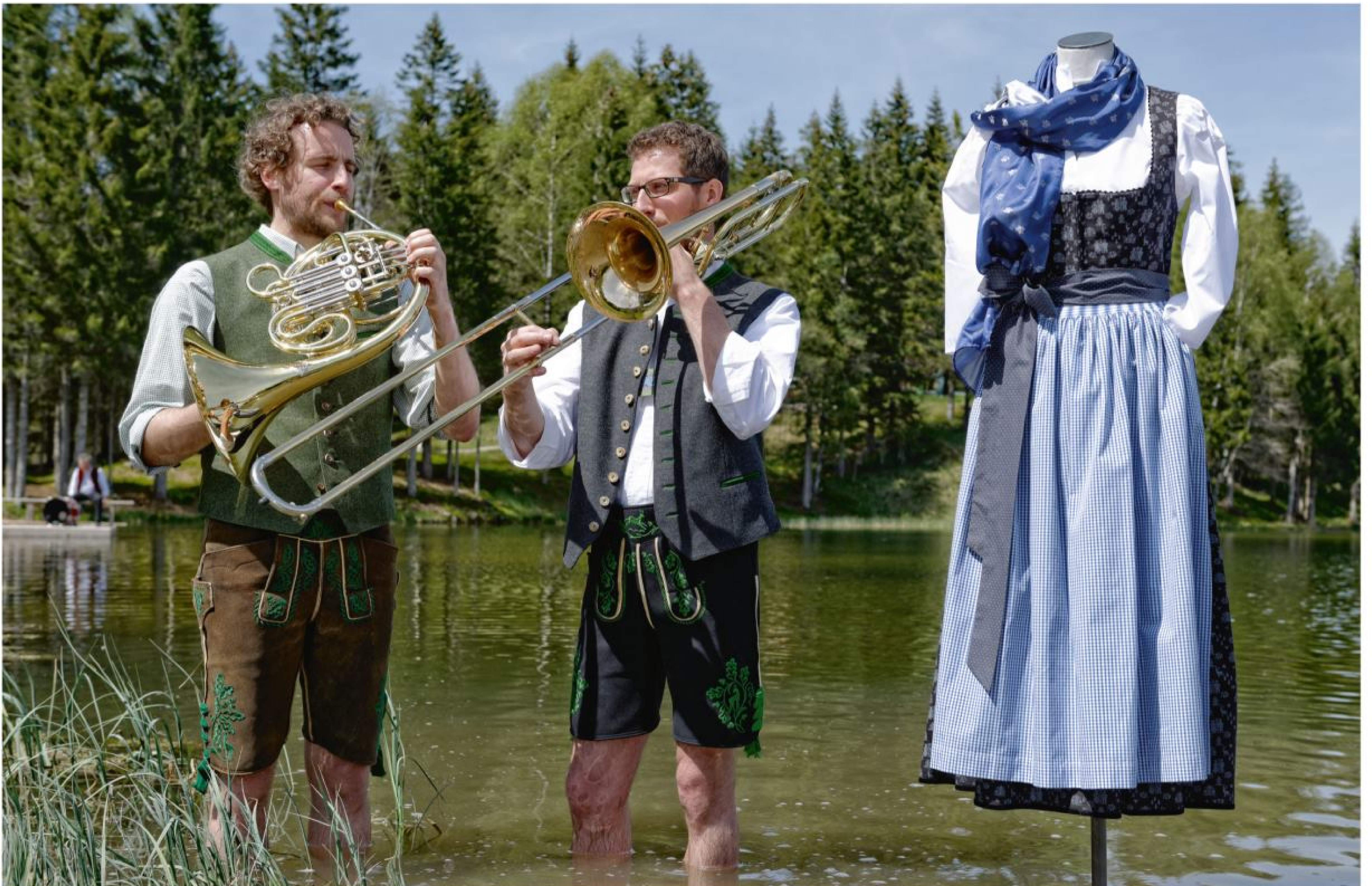
Oben rechts: Lederhose Kreuzeck aus sämisch gegerbtem Hirschleder von Hand bestickt 749 €, Hosenträger aus handbedrucktem Leinen 159 €. Unten: Weste aus Köperloden mit Lodenausputz und Jacquardrücken in fünf Farben 189 €, Streifenpfoad aus reiner Baumwolle 39,90 €, Lederhose Herzog Max Joseph aus sämisch gegerbtem Hirschleder aufwändigst von Hand bestickt 1.498 €.